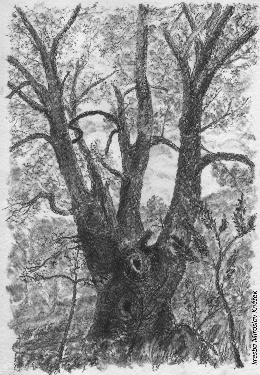
kresba Miroslav Kněžek